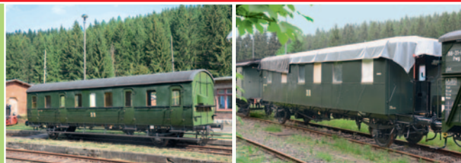
Sitzwagen 541-326, Gattung D-21b, Bj. 1924. Sitzwagen 300-579, Gattung Bip, Bj. ab 1909.