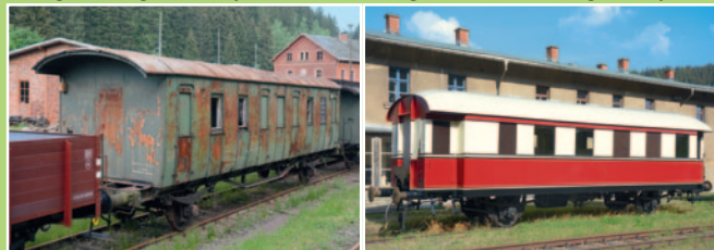
Beiwagen VB 140 227, Gattung Ci 33, Bj. 1933.